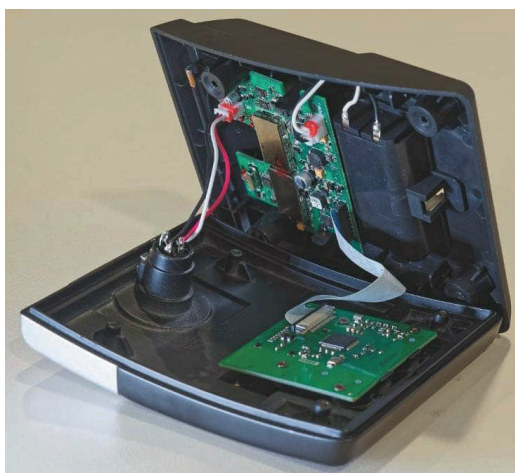
An ihrem oberen Ende verfügen die Sprechstellen über eine verriegelbare XLR-Buchse, die erfreulicherweise in den Aluminiumteil des Gehäuses eingearbeitet ist und nicht direkt auf eine Platine drückt – eine Konstruktionsweise, die Langlebigkeit in Aussicht stellt.

Mit der Funktion Priority lässt sich bis zu zwei Mikrofonen eine Vorrangfunktion zuweisen; bei größeren Aufbauten mit mehreren Receivern besteht in einer Master/Slave-Konfiguration am Hauptgerät Zugriff auf sämtliche angeschlossenen Sprechstellen, die am Display des Masters in Vierergruppen angezeigt werden. Die Darstellung fällt auch in dieser Konstellation übersichtlich aus. Icons weisen den Anwender darauf hin, dass er mehr als nur die lokale Vierergruppe im Zugriff hat. Das System unterstützt bis zu sechs parallel geöffnete Mikrofone (Funktion „NOM Adjustment“, Number of Open Microphones), von denen bis zu zwei mit Priority und vier ohne Priority betrieben werden können. Die Priority-Zuweisung führt nicht zu einer Stummschaltung anderer Mikrofone, sondern senkt lediglich deren Pegel ab („Attenuation“). Sind bereits zwei Priority-Sprechstellen definiert, führt die Aktivierung von Priority für eine weitere Sprechstelle dazu, dass die erste Sprechstelle in den normalen Modus zurückgesetzt wird.