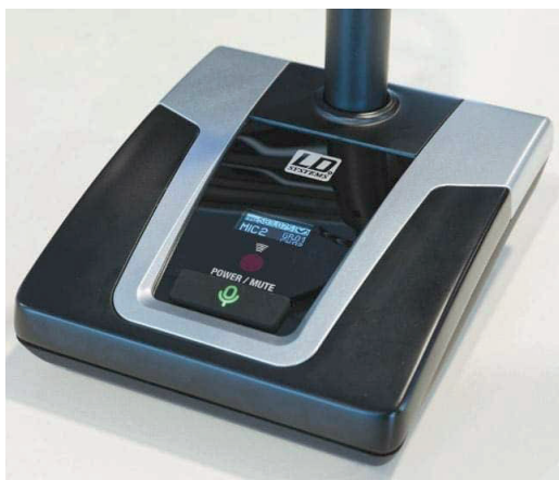
Als Anzeige dient an der Sprechstelle ein rechteckiges OLED-Display, das die ID der Unit, die eingestellte Frequenz, den Batteriestatus sowie Gruppe und Kanal darstellt.

Direkt oberhalb der Taste befindet sich ein Infrarotempfänger, der zwecks Übertragung von Einstellungen vor den Receiver gehalten wird – in der Praxis funktioniert die Synchronisation bei direktem Sichtkontakt und einer Entfernung von vorzugsweise um die 10 cm vollkommen reibungslos und wird durch einen Druck auf den Multifunktionsknopf des Receivers ausgelöst. Ein unhörbarer Pilotton leistet seinen Beitrag zu einer störungsfreien Funkverbindung zwischen Sender und Empfänger.