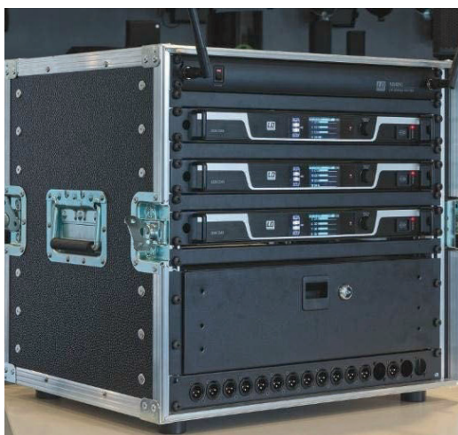
Startklar für den Einsatz: Road-taugliches Rack mit drei Empfängern und einem externen Antennensplitter.

Bei dem LD U50X CS 4-Paket handelt es sich um eine drahtlose Diskussionsanlage, die im UHF-Bereich arbeitet und für drei unterschiedliche Frequenzsegmente verfügbar ist: In die Nutzergruppe „Professionelle drahtlose Produktion“ fallen in Deutschland Ausführungen für die Frequenzbereiche 554 bis 586 MHz (U505CS4) und 662 bis 694 MHz (U506CS4), während sich eine dritte Ausführung (U508CS4, 823 bis 832 MHz plus 863 bis 865 MHz) lizenz- und anmeldefrei betreiben lässt – die „Mittenlücke 800“ und das ISM-Band machen es mindestens bis zum 31. Dezember 2023 (und voraussichtlich auch darüber hinaus) möglich.