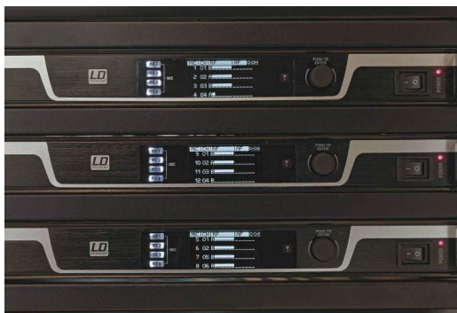
Auf den Home-Screens der Receiver-Displays befinden sich relevante Parameter stets im Blick.

Als Anzeige dient an den Sprechstellen ein rechteckiges OLED-Display, das die ID der Unit, die eingestellte Frequenz, den Batteriestatus sowie Gruppe und Kanal signalisiert. Die ID beschränkt sich aktuell auf eine Anzeige in Form von „MIC11“, doch möglicherweise werden sich in näherer Zukunft nach einem Firmware-Update wie bei anderen Produkten aus der U500-Serie auch beliebige (Teilnehmer-) Namen eintragen lassen – so zumindest die Aussage eines Entwicklers bei LD Systems.