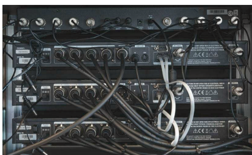
Startklar für den Einsatz: Road-taugliches Rack mit drei Empfängern und einem externen Antennensplitter.

LD Systems ist eine Marke der Adam Hall Gruppe, und am Unternehmenssitz in Neu-Anspach wird Wert darauf gelegt, dass die Produkte „designed & engineered in Germany“ sind. Letzteres steht so beispielsweise auch auf kleinen Aufklebern, die in den Batteriefächern der Sprechstellen angebracht sind und durch den Zusatz „Assembled in PRC“ ergänzt werden – anders wäre die unverbindliche Preisempfehlung kaum erklärbar.