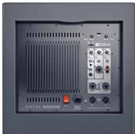
Alle notwendigen Anschlüsse des Dave-8-Roadie-Systems befinden sich auf der Rückseite des Subwoofers

schneller als bei einem auf Wirkungsgrad optimierten, typischeren Beschallungssystem mit hart aufgehängten Treibern in Bassreflexboxen und Hochtonhörnern. Solange man richtig dosiert, ist der Klang aber feiner gezeichnet.