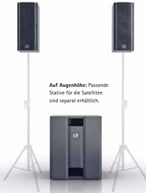
Auf Augenhöhe: Passende Stative für die Satelliten sind separat erhältlich.

Bei einer privaten Party diente die PA als Konserven-Wiedergabe-System für eine Tanzfläche. Es kommt nur auf die Größe des Raumes an. Um 20 Leute richtig abschütteln zu lassen, ist die Mini-PA genau das Richtige. Der Übergang in zerstörerische Verzerrungen erfolgt allerdings