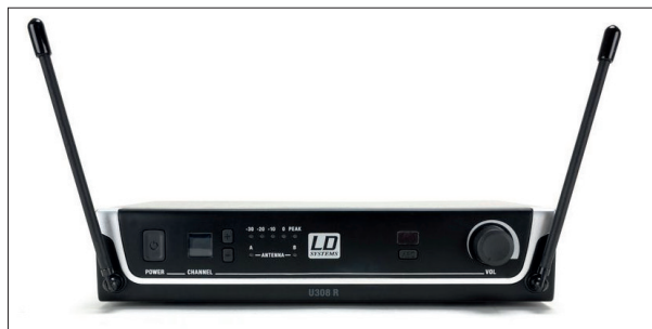
Auf der Vorderseite des Receivers sind überraschenderweise zwei fest verbaute Antenne zu finden

Auf der Rückseite des U308 R ist der Anschluss für den Stecker der Stromversorgung nebst Zugenlastung untergebracht. Außerdem befinden sich hier zwei Ausgangsbuchsen. Zum einen ist das eine XLR-Buchse, die ein symmetrisches Signal mit +10 dBu Bezugspegel ausgibt. Zum anderen handelt es sich um eine 6,3 mm Klinkenbuchse, an der ein unsymmetrisches Signal mit zwei unterschiedlichen Bezugspegeln (+7 dBV und +2,5 dBV) abgegriffen werden kann – je nachdem ob das nachfolgende Gerät ein Line- oder Instrumenten-Signal verarbeiten soll.