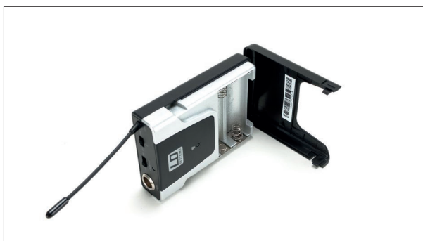
Die Haltespange des Taschensenders eignet sich für die Befestigung an Gürtel oder Hosenbund, aber auch dünne Gurte können längs hindurchgezogen werden