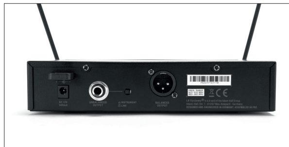
Rückseitig können Signale an zwei Ausgängen mit drei verschiedenen Bezugspegeln abgegriffen werden

Das U308 BPH-Bundle ist mit fünf verschiedenen Funkfrequenzbereichen erhältlich. Die hier getestete Ausführung setzt auf den Bereich von 823-832 MHz und 863-865 MHz. Der untere dieser Frequenzbereiche liegt in der sogenannten Mittenlücke der Mobilfunknetze. Der Betrieb des Funksets mit diesen Frequenzen ist europaweit anmelde- und gebührenfrei. Und auch der obere der beiden Frequenzbereiche liegt in einem europaweit anmelde- und gebührenfrei nutzbaren Bereich, dem EU-Band/SRD-Band für Geräte mit kurzen Reichweiten. Übrigens lassen sich maximal sechs U308 BPH Funksysteme parallel betreiben, wobei für jede Funkstrecke sechs Kanäle zur Auswahl stehen. Somit ist die Funkstrecke sowohl weitreichend als auch flexibel einsetzbar.