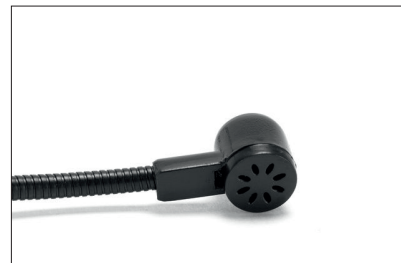
Rückseitige Luftschlitze verhindern, dass sich Schall im Mikrophonkopf aufschaukelt und allzu starke Resonanzen erzeugt