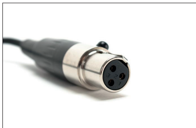
Ein Mini-XLR-Stecker mit Rückhaltesicherung sorgt für sicheren Anschluss des Head-Mics. Am Receiver befindet sich eine Öse zum Anbringen einer Zugentlastung

tauglichen Eindruck. Die 10 Stunden Betriebsdauer erreicht das Testgerät allerdings nicht. Eine Abschaltautomatik hat der Sender nicht. Wie gut, dass die Betriebsleuchte auf der Kopfseite des Senders darauf hinweist, sofern das Gerät noch nicht ausgeschaltet ist.