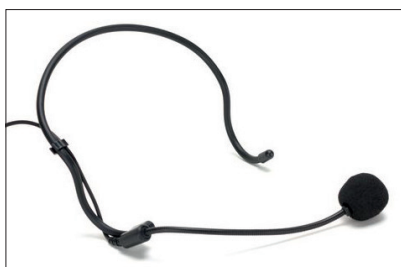
Die ergonomische Form des Headsets (hier auf dem Kopf stehend) sorgt für angenehmen Sitz