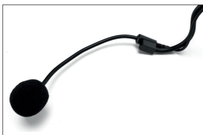
Der flexible Schwanenhals des Head-Mics ist sehr leicht biegsam