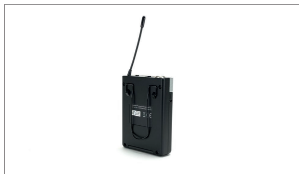
Am Receiver befindet sich eine Öse zum Anbringen einer Zuggelastung