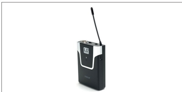
Form und Aufbau des Taschensenders folgen etablierten Vorbildern