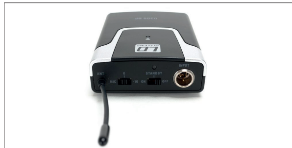
Die Justierung der Signallautstärke sowie der Kopfhöreranschluss finden sich leicht zugänglich an der Oberseite

Auf der Vorderseite befindet sich eine Kontroll-LED. Sie zeigt an, wenn das Herstellen der Funkverbindung erfolgreich war. Auf der Oberseite sind jeweils außen Antenne und Mikrofoneingang untergebracht. Außerdem befindet sich hier je ein Schiebeschalter für die Wahl der Vorverstärkung (abgesenkter Mic-Level, Standardeinstellung und 10 dB Boost). Komplettiert wird dieses Ensemble durch einen Schiebeschalter für An/Aus und die Standby-Aktivierung. Letzteres wird vom Aufleuchten einer Aktivitäts-LED quittiert. Der Taschensender hat übrigens keine Abschaltautomatik. Wer vergisst, das Gerät auszuschalten, leert damit die eingelegten Batterien bis zu deren letztem Atemzug.