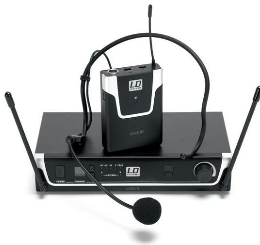
LD Systems U308 BPH: drahtlose Kopfmikrofon-Anlage

Die Drahtlosanlage LD Systems U308 BPH möchte zum nahezu konkurrenzlosen Preis mit Lieferumfang, Pilotton, Squelch und einfacher Infrarot-Synchronisation mittels einer einzigen Taste punkten. Auf dem Bonedo-Prüfstand muss das in Deutschland entwickelte Funksystem beweisen, wie praxistauglich es ist.