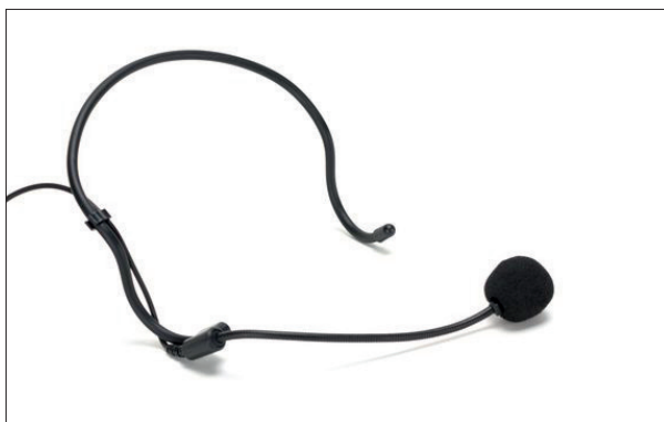
Das Kopfmikrofon macht trotz all seiner Schlichtheit einen guten, weil wertigen ersten Eindruck

Auf der Vorderseite befindet sich eine Kontroll-LED. Sie zeigt an, wenn das Herstellen der Funkverbindung erfolgreich war. Auf der Oberseite sind jeweils außen Antenne und Mikrofoneingang untergebracht. Außerdem befindet sich hier je ein Schiebeschalter für die Wahl der Vorverstärkung (abgesenkter Mic-Level, Standardeinstellung und 10 dB Boost). Komplettiert wird dieses Ensemble durch einen Schiebeschalter für An/Aus und die Standby-Aktivierung. Letzteres wird vom Aufleuchten einer Aktivitäts-LED quittiert. Der Taschensender hat übrigens keine Abschaltautomatik. Wer vergisst, das Gerät auszuschalten, leert damit die eingelegten Batterien bis zu deren letztem Atemzug.