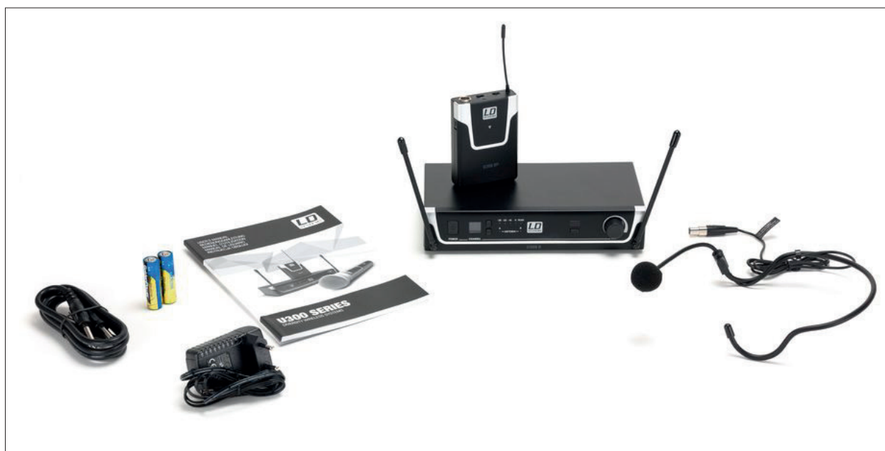
LD Systems U308 BPH Unboxing und Lieferumfang