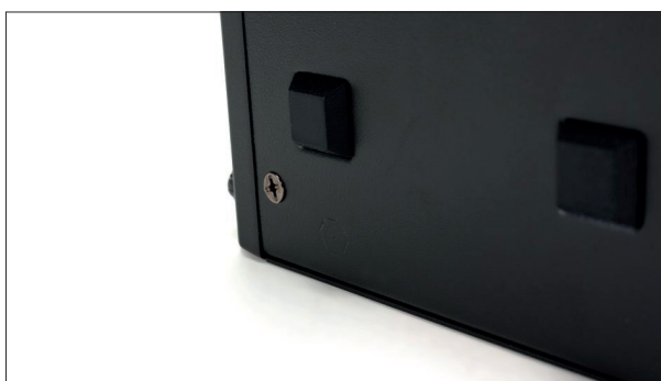
An der Unterseite des Receivers verhindern geklebte Gummifüßchen das Verrutschen auf glatten Oberflächen

Der Ein/Aus-Taster funktioniert erst nach einem etwa eine Sekunde langen Druck. Das verhindert sein versehentliches Betätigen. Das Display ist auch in hellen wie dunklen Umgebungen gut ablesbar. Was mir ebenfalls gut gefällt, ist der Volume-Regler. Er ist ungerastert und bietet ausreichend mechanischen Widerstand, um eine feine Justierung zu ermöglichen.