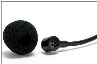
Der Kopf des Kopfmikrofons wird von einem aufgesteckten Windschutz umgeben