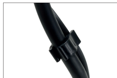
Eine verschiebbare, gesteckte Kabelklemme sorgt für Ordnung