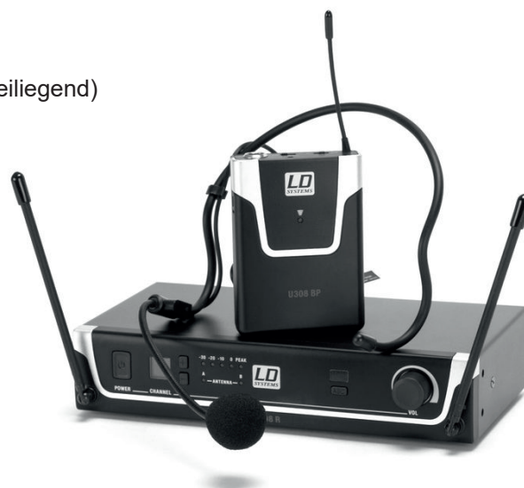
LD Systems U308 BPH: drahtlose Kopfmikrofon-Anlage