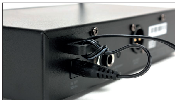
Das Batteriefach des Taschensenders ist praktischerweise von der Vorderseite aus zugänglich