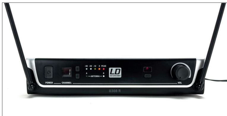
Die Anzeigen auf der Vorderseite sind schlicht, aber hilfreich